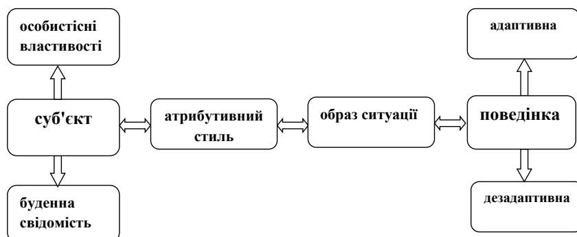
Рис. 2. Функціональна модель становлення атрибутивного стилю особистості дорослих

У досліджуваній системі взаємодії «суб'єкт – ситуація» атрибутивний стиль дорослої людини сприяє формуванню образу ситуації у свідомості суб'єкта, а отже, опосередковує вибір суб'єктом стратегії реагування, яка буде адаптивною чи навпаки, дезадаптивною. Виходячи з цієї схеми, у дослідженні становлення атрибутивного стилю дорослого можна говорити насамперед про становлення адаптивних можливостей атрибутивного стилю.