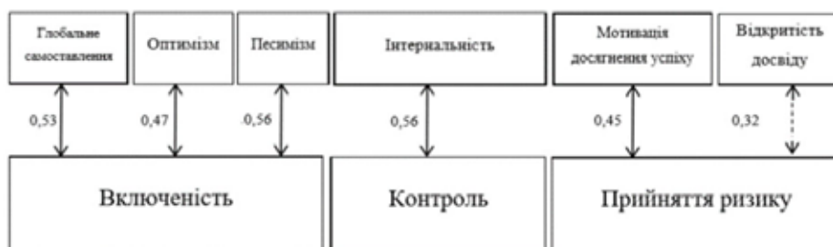
Рис. 2. Зв'язок життєстійкості із самоставленням, оптимізмом, мотивацією досягнення успіху та відкритістю досвіду

Зростання внутрішнього локусу контролю супроводжується підвищенням загального самоставлення ( r = 0,50 ) та його окремих аспектів: "самоповаги" ( r = 0,62 ), "очікуваного відношення" ( r = 0,36 ), "реального відношення" ( r = 0,46 ), "саморозуміння" ( r = 0,46 ) та "самокерівництва" ( r = 0,67 ). Менш значимими ( p < 0.05 ) є виявлені зв'язки із "самоінтересом" ( r = 0,28 ) та "самоприйняттям" ( r = 0,25 ). Особи, які беруть відповідальність