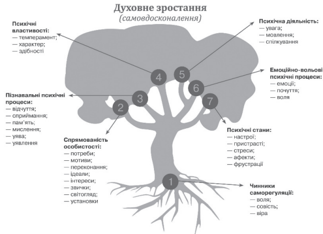
Рис. 1. Психологічна структура особистості за С. Максименко, Н. Жигайло

Авторська психологічна структура духовної особистості (рис.1) представлена нами у вигляді дерева, основа (коріння) якого базується на чинниках саморегуляції, якими є воля, совість і віра; гілки цього дерева – це наші пізнавальні та емоційно-вольові психічні процеси, психічні стани, психічні властивості, психічна діяльність, спрямованості особистості тощо, а верхівка цього дерева прагне до духовного зростання, тобто до самовдосконалення.