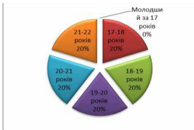
Рис. 1. Вік респондентів досліджуваної вибірки

У емпіричному дослідженні було використано наступні методики: 1) анкетування студентів з метою з'ясування окремих критеріїв впливу на процес вибору ними професії; 2) методика «Ціннісні орієнтації» М. Рокича, спрямована на визначення системи ціннісних орієнтацій студентів зазначеної вибірки [8].