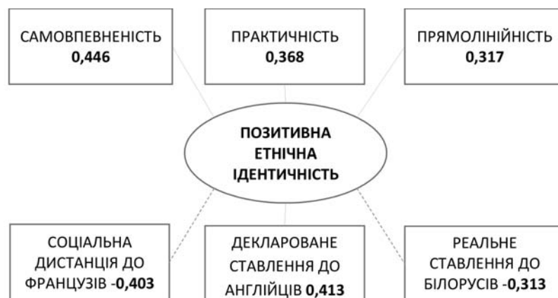
Рис. 5. Взаємозв'язки позитивної етнічної ідентичності з особистісними особливостями та етнічним ставленням у групі українців досліджуваних

Позитивна етнічна ідентичність взаємозалежна з самовпевненістю, практичністю, прямолінійністю, декларованим ставленням до англійців і зворотно корелює з дистанційованістю від французів, реальним ставленням до білорусів (рис. 5). Особи, яким це притаманно, ставляться до себе як до впевненої, самостійної, вольової та надійної людини, яку є за що поважати. Вони орієнтуються на зовнішню реальність і дотримуються загальноприйнятих норм. Ці риси є основою такого типу етноідентичності, що передбачає поєднання позитивного ставлення до власного народу з позитивним ставленням до інших народів. У поліетнічному суспільстві позитивна етнічна ідентичність має характер норми і властива переважній більшості. Вона задає такий оптимальний баланс толерантності стосовно власної і інших етнічних груп, який дає підстави розглядати її, з одного боку, як умову самостійності та стабільного існування етнічної групи, з іншого – як умову мирної міжкультурної взаємодії в поліетнічному світі.