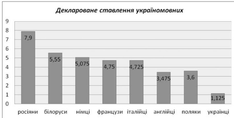
Рис. 3. Рейтинг декларованого ставлення до етнічних груп україномовними досліджуваними (від негативного до позитивного)