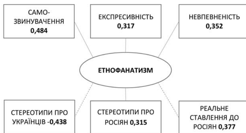
Рис. 8. Взаємозв'язки етнофанатизму з особистісними особливостями та етнічним ставленням у групі російськомовних досліджуваних

Негативні кореляції показник етнофанатизму має зі стереотипами про українців, реальним ставленням до росіян, а прямі кореляції – зі стереотипами про росіян. Тобто, ті особи, які впевнені в перевазі свого народу над іншими, уявляють їх гіршими за себе, формуючи негативні стереотипні уявлення. Натомість вони сприятливо ставляться до представників власної етнічної групи, вибудовуючи соціальні взаємозв'язки з ними на фоні позитивних автостереотипів.