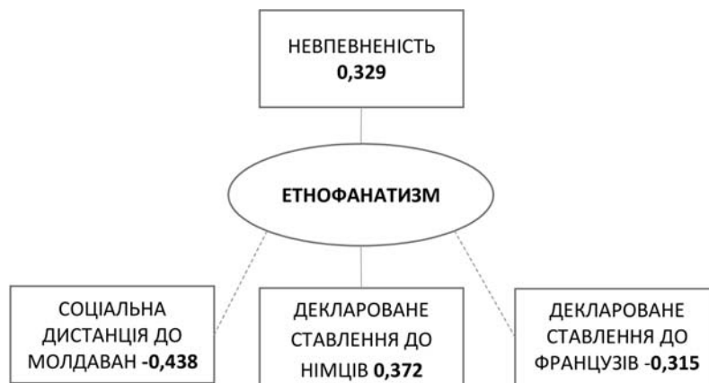
Рис. 6. Взаємозв'язки етнофанатизму з особистісними особливостями та етнічним ставленням у групі україномовних досліджуваних

Етнофанатизм у групі україномовних підлітків прямо корелює з невпевненістю як особистісною рисою (рис. 6). Це, очевидно, спонукає підлітків ревніше відстоювати права свого народу, компенсуючи власну невпевненість належністю до більшості, яка таку впевненість надає. Етнофанатизм часто свідчить про готовність йти на будь-які дії в ім'я етнічних інтересів, визнання пріоритету етнічних прав народу над правами людини, виправдання будь-яких жертв у боротьбі за благополуччя свого народу.