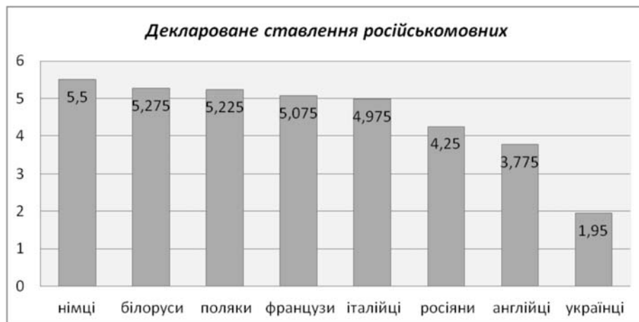
Рис. 4. Рейтинг декларованого ставлення до етнічних груп російськомовними досліджуваними (від негативного до позитивного)

У російськомовних досліджуваних найліпше ставлення теж до українців, натомість другу і третю позиції займають англійці та росіяни (рис. 4). У цієї групи підлітків досить тісна ідентифікація з власною етнічною групою, проте проживання в Україні накладає свій відбиток на побудову соціальних стосунків і формування ставлення до інших етногруп. Цікавим є і те, що до решти етнічних груп, які ці досліджувані мали змогу оцінити, вони демонструють майже однакове ставлення. Це може бути пов'язано з недостатньою поінформованістю про культурні особливості представників цих етносів, а також із браком досвіду безпосередніх контактів з ними.