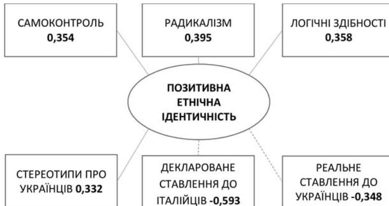
Рис. 7. Взаємозв'язки позитивної етнічної ідентичності з особистісними особливостями / та етнічним ставленням у групі російськомовних досліджуваних

ють емоційну забарвленість і динамічність спілкування. Заразом вони невпевнені в собі, страждають від надмірного самозвинувачення, негативних емоцій на адресу власного «Я». Такі негативні ознаки самоствавлення можуть бути чинниками приєднання до груп етнофанатиків, де підлітки можуть компенсувати цю внутрішню нестабільність.