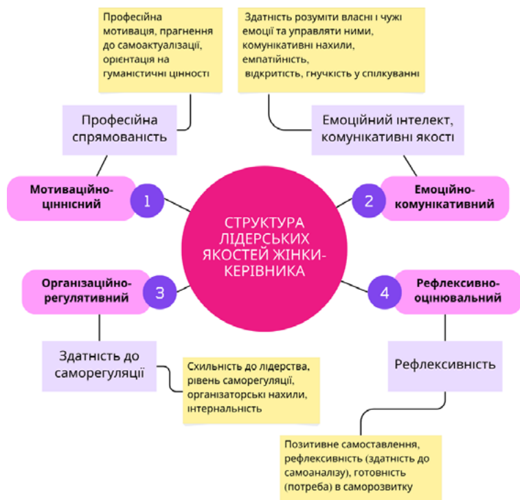
Рис. 2. Схема структури лідерських якостей жінки-керівника

Проаналізуємо більш детально основні складові компоненти лідерських якостей жінки-керівника.