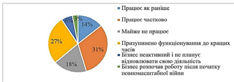
Рис. 2. Робота українського бізнесу в умовах війни (2024 р.)

Для кращого розуміння сучасних тенденцій у діяльності підприємств проаналізуємо частки підприємств, що припинили свою діяльність внаслідок початку війни у 2024 році (рис. 3).