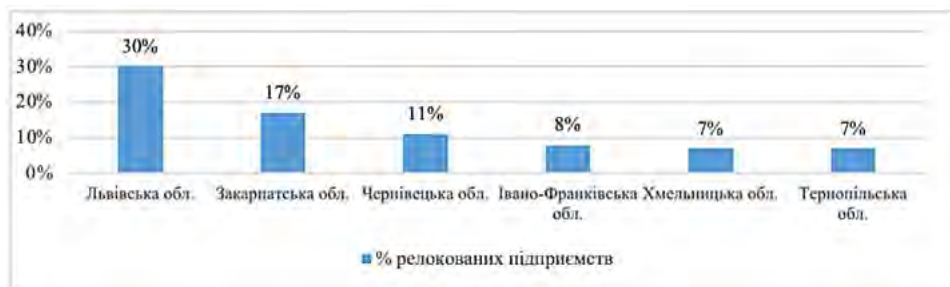
Рис. 6. Територіальний розподіл релокованих підприємств українського бізнесу у % за 2024 рік

Для детальнішого аналізу розглянемо територіальний аспект релокації бізнесу в Україні (рис. 6).