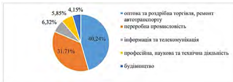
Рис. 5. Структура релокованих підприємств українського бізнесу за галузями у 2024 році

державного підтримання бізнесу з даною програмою надається підприємствам стратегічного значення. Детальніше галузевий аналіз релокованих підприємств розглянемо на рис. 5.