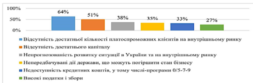
Рис. 4. Основні перешкоди, що заважають відновлюватися українському бізнесу в умовах війни

Незважаючи на те, що кожна сфера бізнесу має свої труднощі розвитку та функціонування в умовах війни, на основі проведеного опитування бізнесу з різних сфер та розмірів, можемо виділити основні спільні перешкоди для усього українського бізнесу (рис. 4).